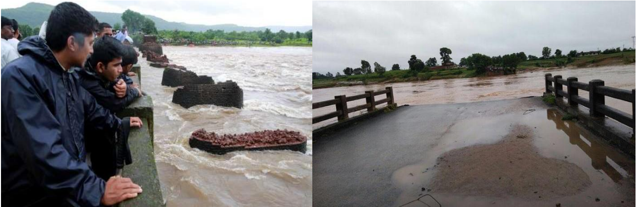
la route vers Pratappur

Kodaura, Pratappur et Jagnathpur sont comme des îles. Les officiers du District essaient de réparer les ponts brisés et de régulariser les facilités de transport. Aussi longtemps que les routes et les ponts ne soient pas encore réparés, nous n'avons pas de liens avec ces communautés. Nous sommes très reconnaissantes de ce que toutes nos Sœurs sont saines et sauvées. Tous les foyers d'accueil et tous les enfants des écoles sont aussi en sécurité. Mais un nombre de villages ont été affectés et beaucoup de gens ont perdu leur maison et leurs champs de riz emportés par les eaux. . Veuillez prier pour les gens et pour nos Sœurs, spécialement pour les villageois qui ont été touchés.